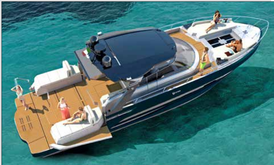
Dévoilé au Cannes Yachting festival en septembre dernier, le Regina 470 possède tous les attributs du grand day-boat moderne, comme ce spectaculaire cockpit de plain-pied.

● Long. 15,10 m ● Larg. 4,40 m ● Poids 16 t ● Transm. IPS Volvo ou hors-bord ● Prix à partir de 876 000 € TTC ● Distribution Modern Boat (Port La Napoule, 06)