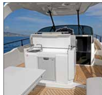
La kitchenette est adossée à la banquette pilote et peut s'équiper d'un réchaud gaz ou induction.